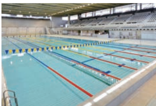
50mプールは8コース、25mプールは6コース! プールの聖地で泳ごう!